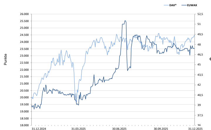
Abb. 1: Kursentwicklung der Aktie der EUWAX Aktiengesellschaft 2025 im Vergleich zum DAX (auf Basis der Schlusskurse)

Der Kurs der EUWAX-Aktie bewegte sich auf Jahressicht in einer Spanne zwischen 38,40 € und 51,50 €. Nach einem Anstieg im ersten Halbjahr, der bis zum Dividendenstichtag anhielt und einer anschließenden Korrektur setzte im letzten Quartal eine moderate Stabilisierung ein, und die Aktie schloss das Jahr mit einer positiven Performance von 22 % ab. Zum Jahresende notierte die EUWAX-Aktie bei 47,40 € (Vj. 39,00 €).